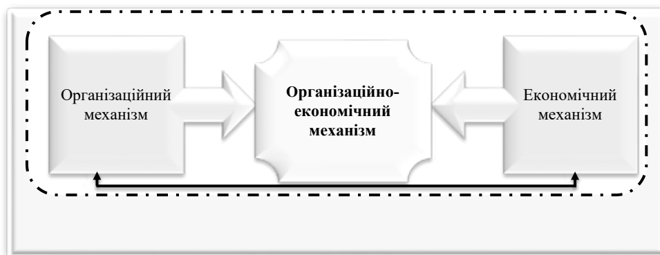
Рис. 1. Структуризація категорій «господарський механізм», «організаційний механізм», «економічний механізм»

Формування й реалізація організаційно-економічного механізму регулювання зайнятості в аграрному секторі економіки – це першочерговий етап в управлінні складним економічним явищем, який дасть змогу сформувавши та вжити заходів, що забезпечать стабільність і сформувавши напрями для подальшого перспективного розвитку. Для