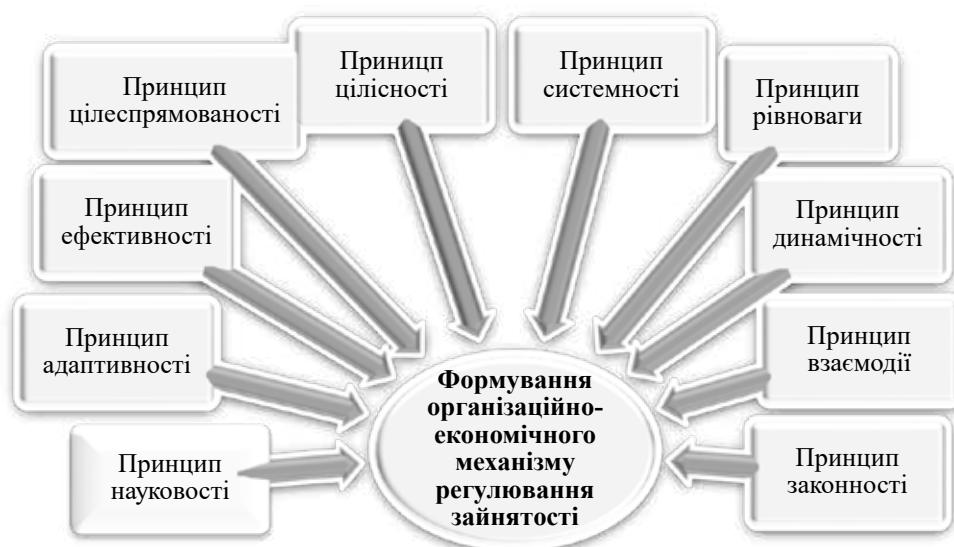
Рис. 2. Принципи формування організаційно-економічного механізму регулювання зайнятості в аграрному секторі економіки

Обґрунтовано, що регулювання зайнятості, яка втілює численні причинно-наслідкові зв'язки організаційного та економічного спрямування, має базуватись на позиціях системного підходу. У результаті цього запропоновано структурно-компонентний підхід до формування та реалізації організаційно-економічного механізму регулювання зайнятості в аграрному секторі економіки, який дає змогу виокремити організаційні, економічні важелі впливу на зайнятість, сприятиме зростанню продуктивності праці та її оплати, рівня мотивації працівників, подоланню безробіття, детінізації доходів працівників галузі, розвитку форм організації аграрної праці, що в сукупності створюватиме основу економічного зростання аграрного виробництва в країні, стимулюватиме розвиток сільських територій та зміцнюватиме продовольчу безпеку держави.