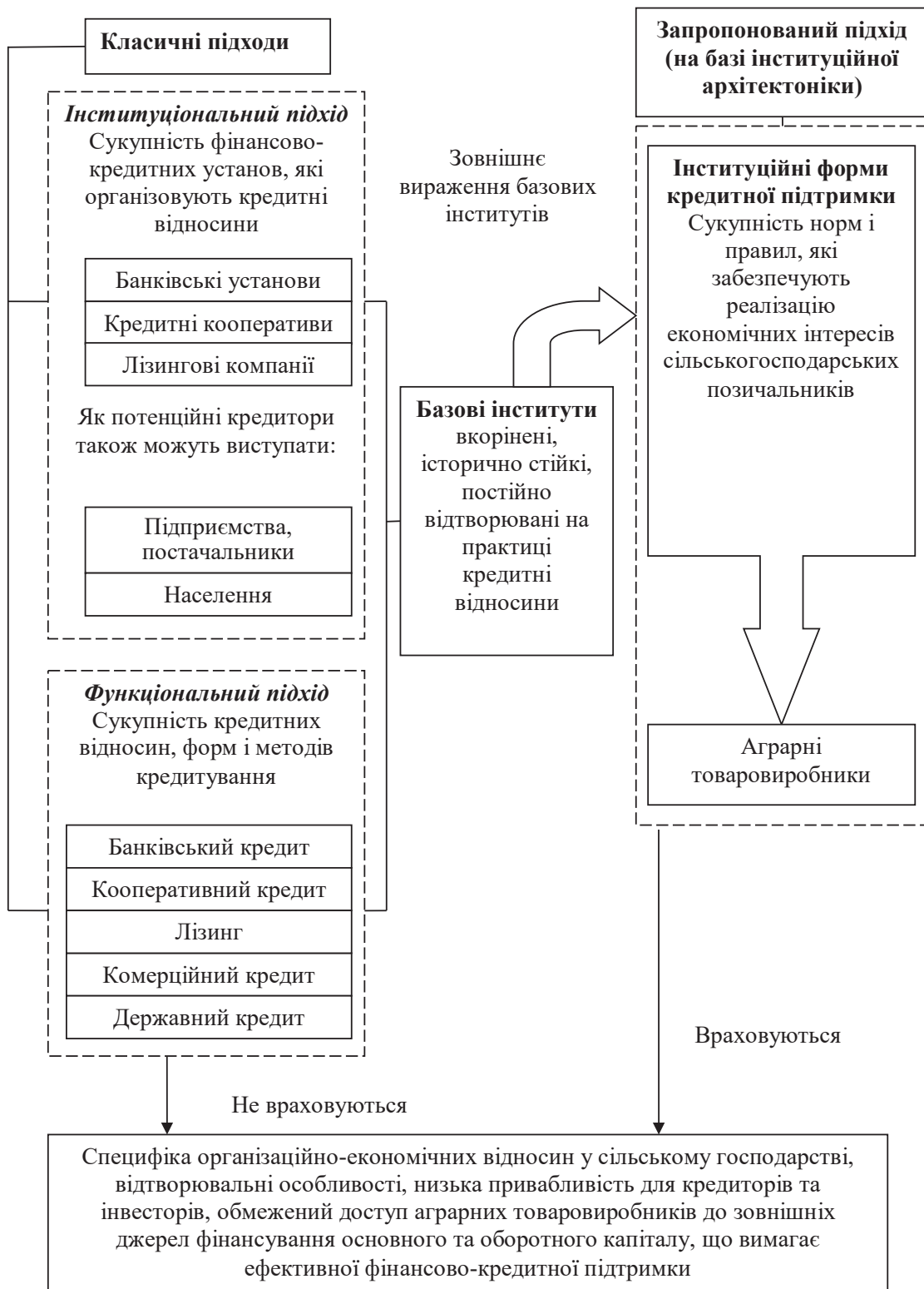
Рис. 1. Інституційні форми кредитної підтримки аграрних товаровиробників