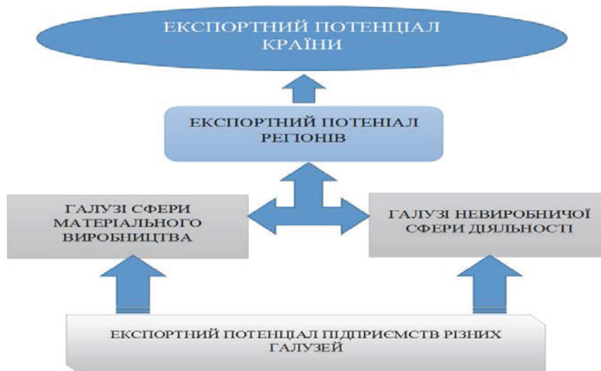
Рис. 1. Структуруючі елементи експортного потенціалу країни

Тенденція до зменшення питомої ваги регіону СНД у зовнішній торгівлі України (із 40,1% у 2013 р. до 19,1% у 2018 р.) та одночасне зростання частки