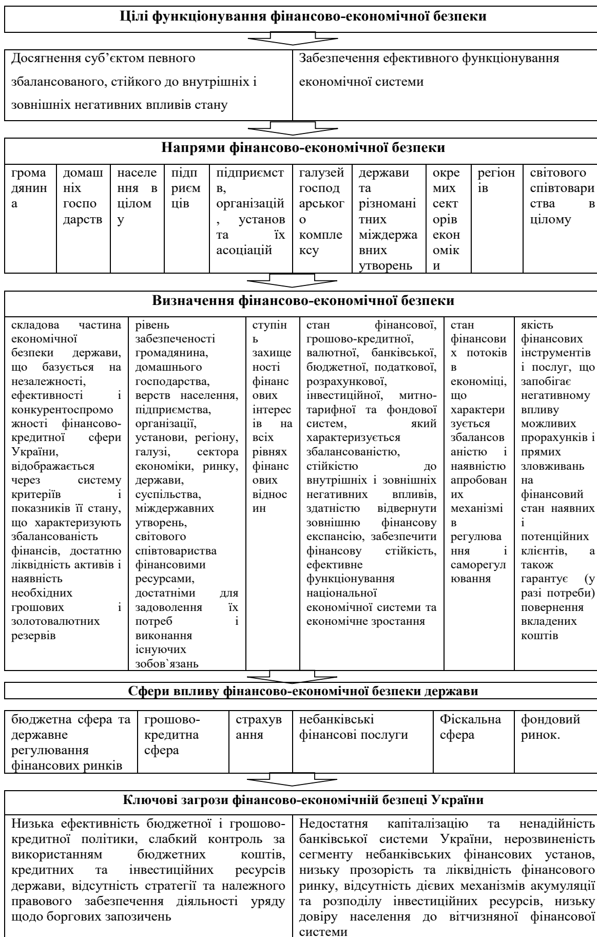
Рис. 3. Концептуальний підхід до фінансово-економічної безпеки